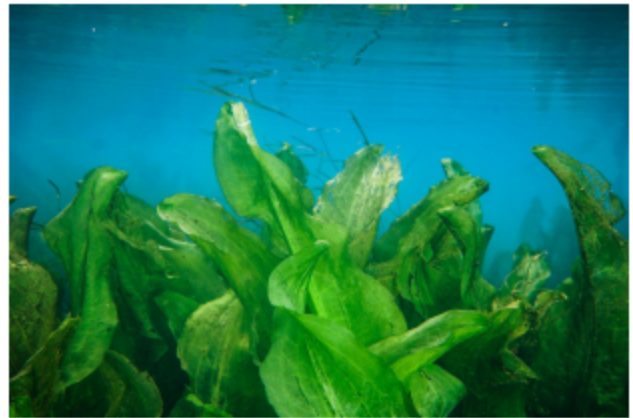
图 1、2：水质指示生物海菜花

海菜花计划 V2.0 为贵州省内有意愿参与生态环境保护尤其是水环境保护等工作的个人或团队提供专项小基金（包括团队发展小基金、生态保护小基金、环境教育小基金、科学研究小基金、风险管理小基金等）、专题培训、活动平台、陪伴等支持与服务，支持个人或团队因地制宜开展生态环境保护、环境教育、可持续生活方式倡导等工作，培育在地环保力量，推动生态环境改善，建设生态文明。